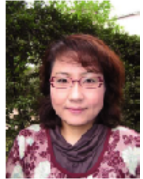
東京都【ドックサロン】