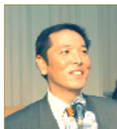
福岡県 [美容総合商社 専務]